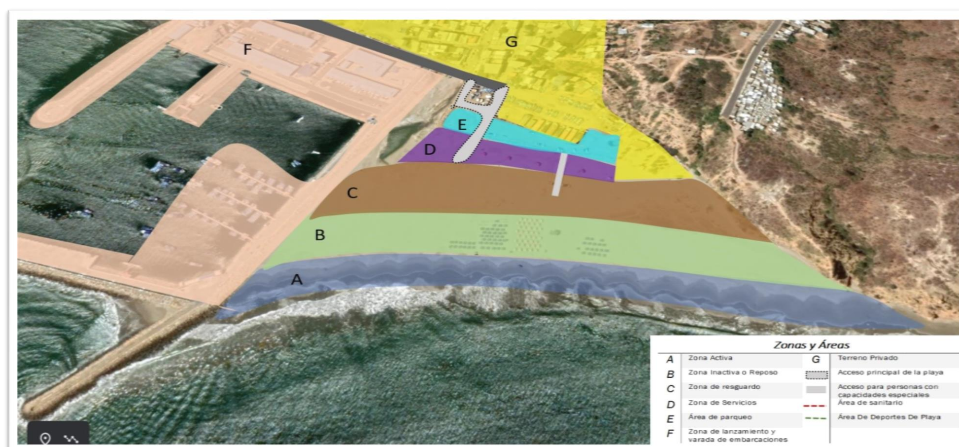
Zonificación de la playa de San Mateo. Ordenación y delimitación de usos de las zonas y áreas.

Servicios o infraestructura que le gustaría que se implemente en la playa de San Mateo.