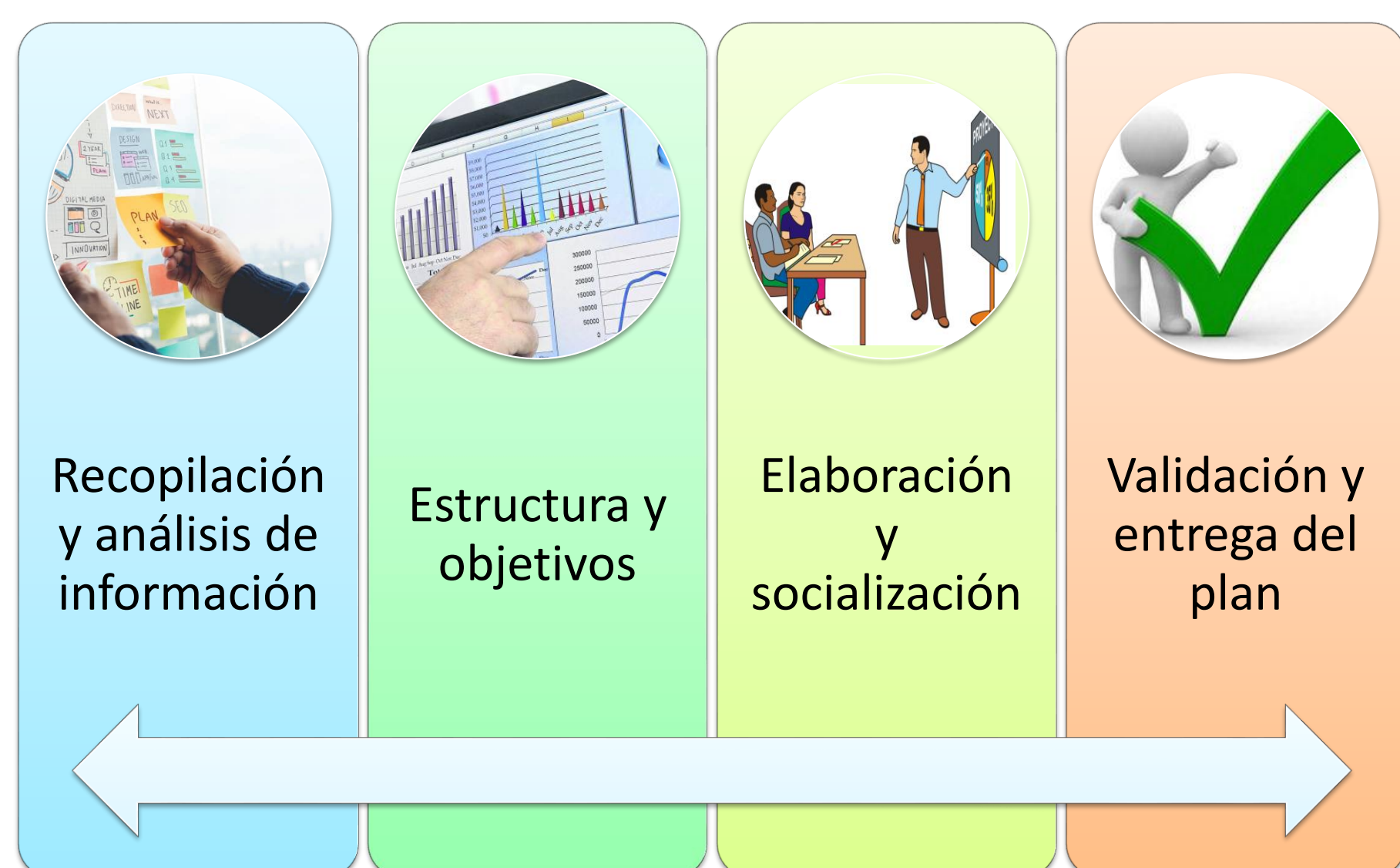
Fases del Plan de Manejo

La propuesta consiste en la elaboración de un plan de manejo para la playa de San Mateo que beneficiará a los usuarios y prestadores de servicios turísticos mediante la aplicación de estrategias y normas de forma sostenible para el aprovechamiento del atractivo turístico.