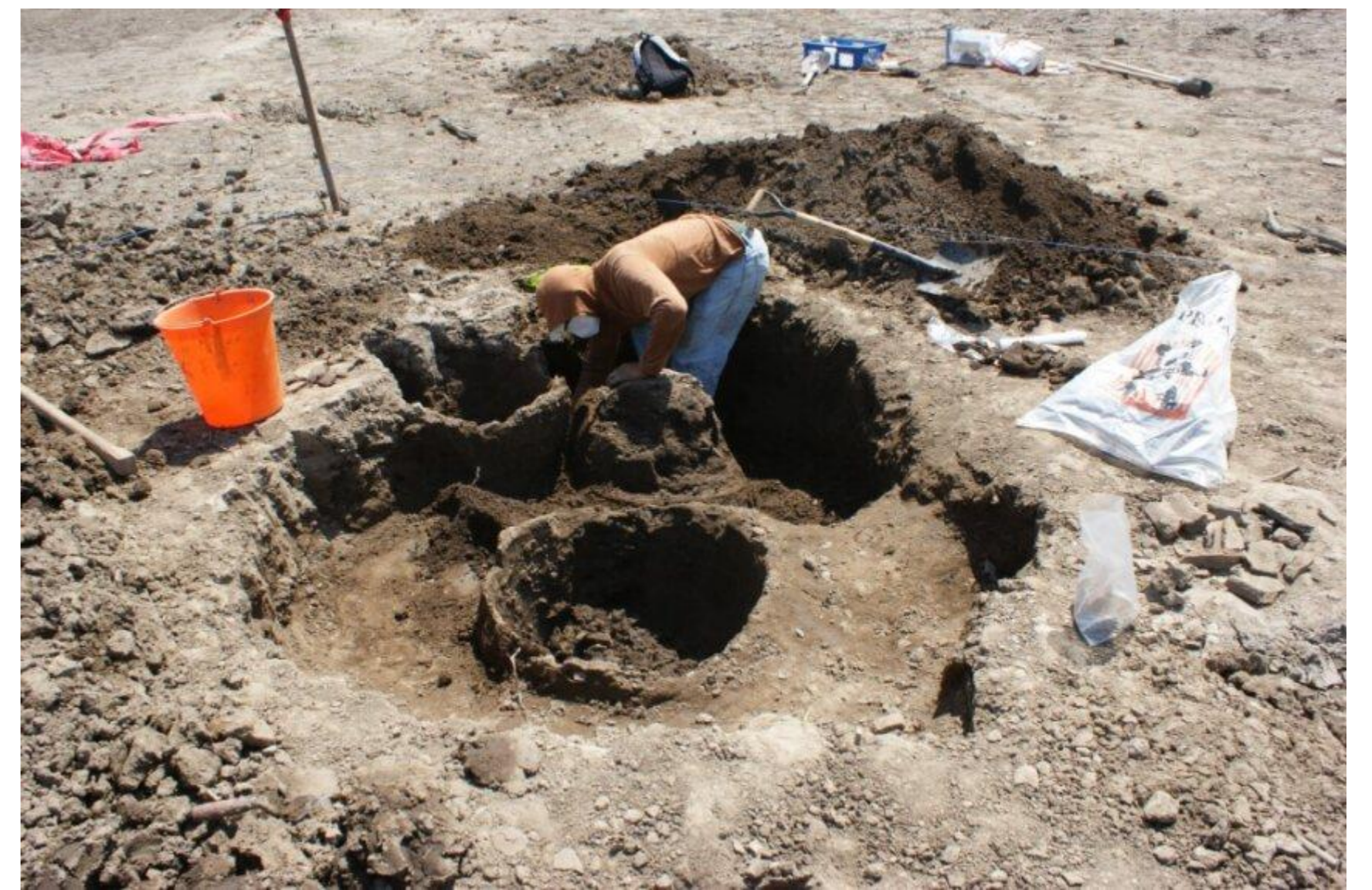
Título: Rescate del hallazgo en la Cooperativa San Enrique, Bermejo de Abajo. Autor: Guilherme Mongelo

1.- Contratar cuadrillas de arqueólogos dentro de los Gobiernos autónomos descentralizados (GAD) y Municipios, para el monitoreo, investigación y control de asentamientos urbanos.