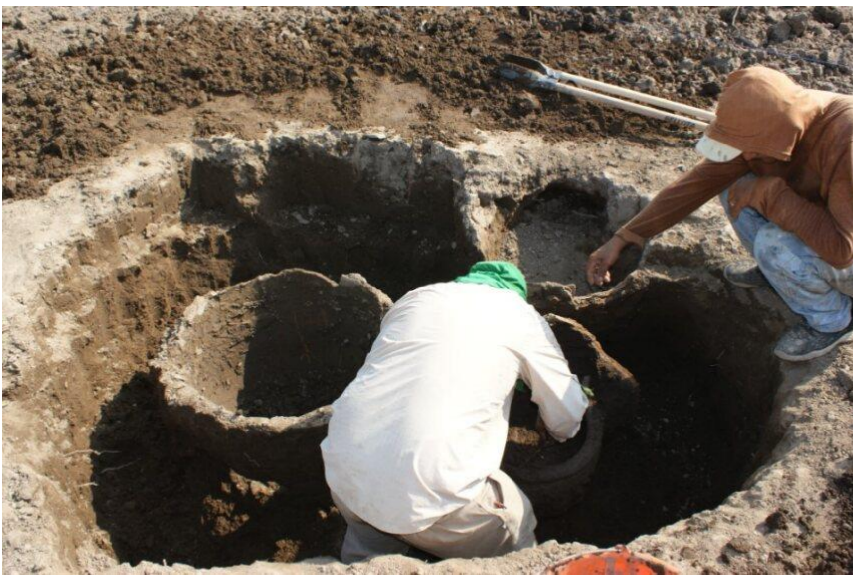
Título: Rescate del hallazgo en la Cooperativa San Enrique, Bermejo de Abajo. Autor: Guilherme Mongelo

2.- Análisis tecno-tipológico del material cerámico huaqueado, para la identificación de su afiliación cultural, realizando un aporte histórico a la construcción del pasado prehispánico del Guayas.