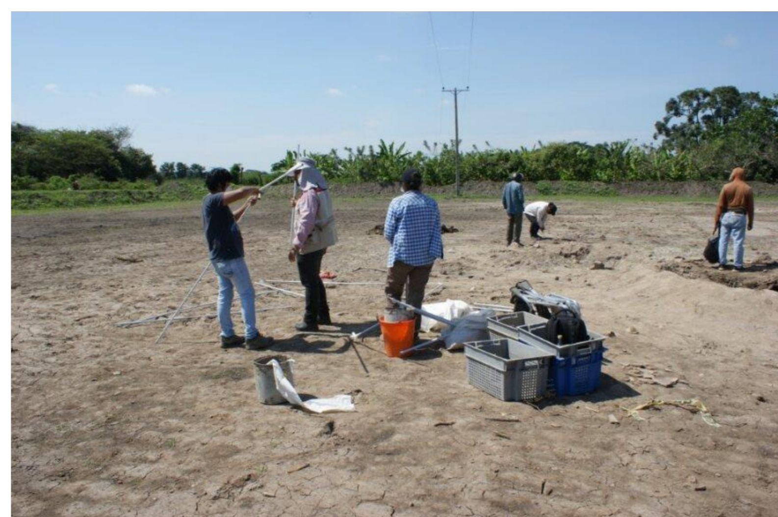
Título: Rescate del hallazgo en la Cooperativa San Enrique, Bermejo de Abajo. Autor: Guilherme Mongelo

La tola del recinto Bermejo de Abajo si es una tola multicomponente, que tiene dos ocupaciones en prehispánicas; Por una parte, en el periodo Formativo tardío con la cultura Chorrera y por otra parte en el periodo de Integración con la cultura Milagro-Quevedo, al llegar a esta conclusión podemos identificar un vacío en la cronología propuesta por Acuña y Chancay (1997), pero esto se puede dar por diferentes factores, ya que el sitio en cuestión se encontraba destruido y huaqueado, sin dejar de lado que junto al sitio se encuentra la carretera principal, este puede ser uno de los motivos por los que se encuentra material Chorrera, dentro de nuestra muestra.