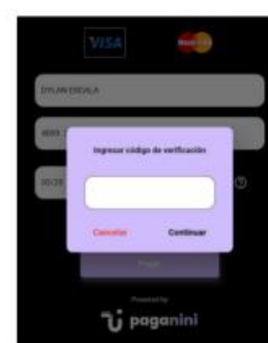
Código de verificación