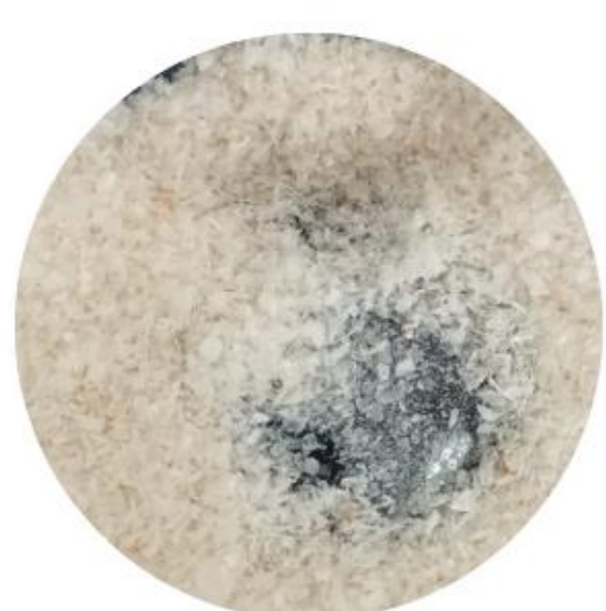
Figura 2. Quitosano obtenido por el método 1