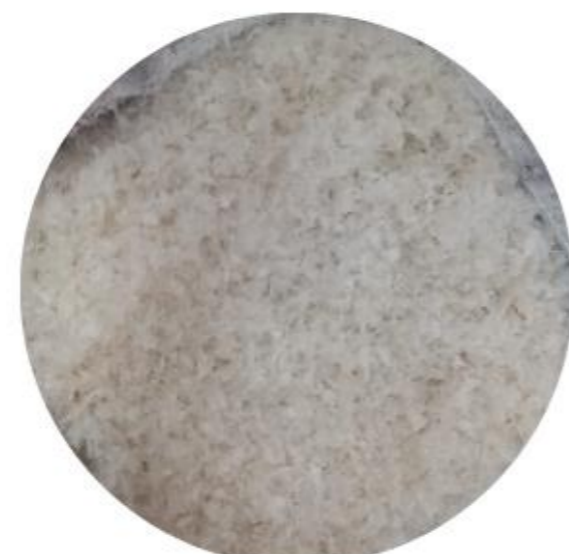
Figura 3. Quitosano obtenido por el método 2