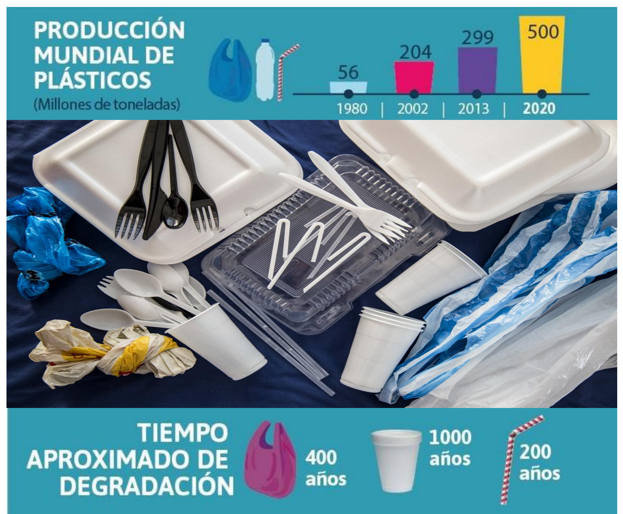
Figura 1. Cifras del mundo sobre el uso de plásticos