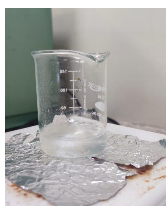
Figura 6. Prueba de solubilidad del bioplástico