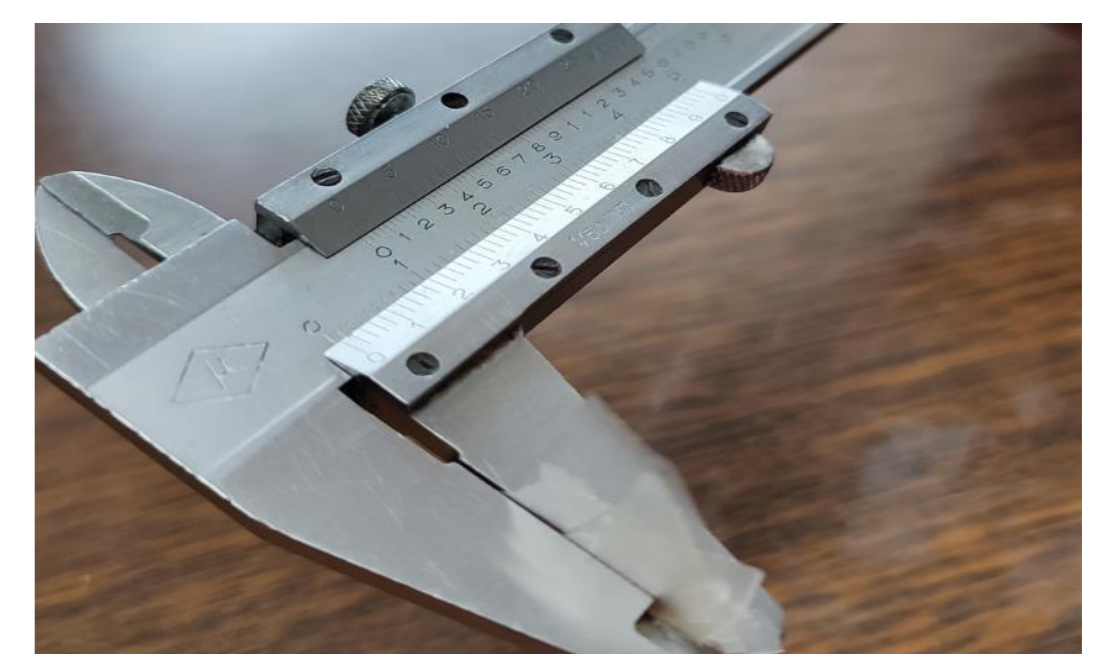
Figura 5. Medición del espesor del bioplástico