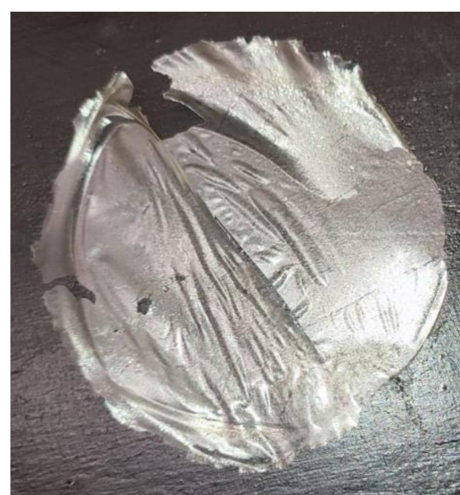
Figura 4. Muestra de bioplástico obtenido