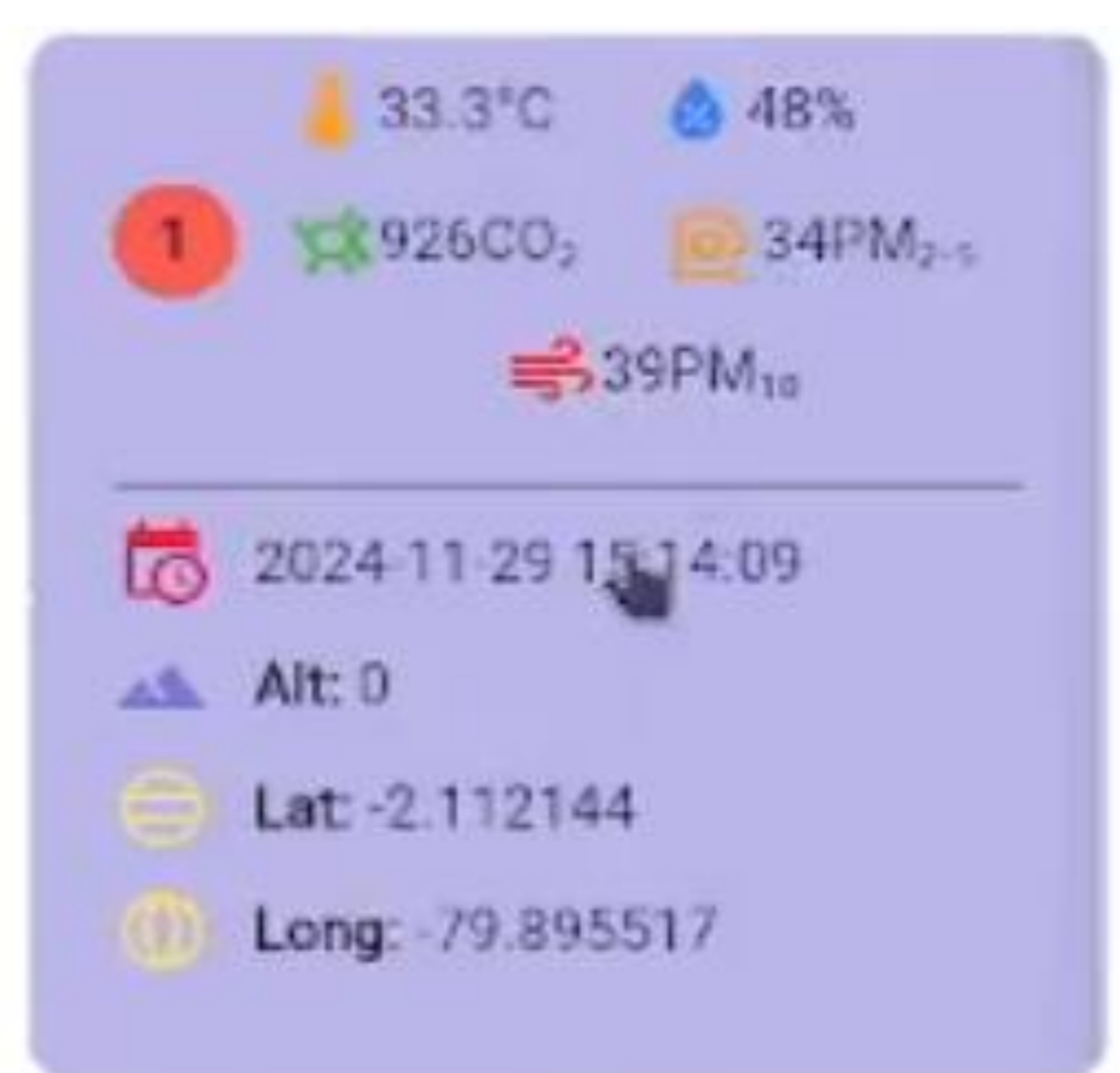
Recolección de datos