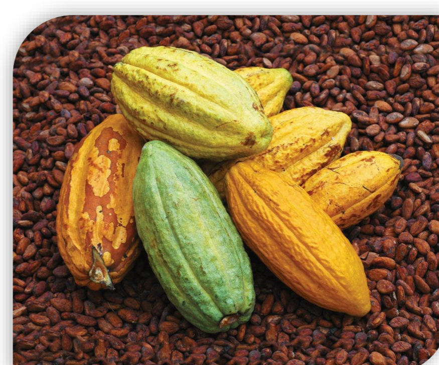
Cacao fino de aroma o nacional

Elaborar una propuesta de manejo agroeconómico dirigido a pequeños productores de cacao orgánico, para registrar los gastos en el mantenimiento del cultivo, a través del uso de herramientas financieras como el presupuesto empresarial y el estado de resultados.