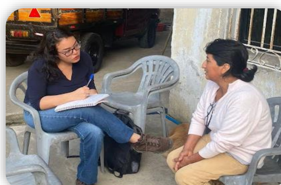
Entrevistas con productores

Se contó con la colaboración de la asociación Costa Azul, la cual cuenta con una población de 21 unidades de producción agropecuaria (UPA), y se eligió una muestra por conveniencia del 50% para proceder con la recolección de información respecto al ámbito financiero del cultivo de cacao, a través de entrevistas estructuradas abiertas dirigidas a los dueños de finca de cada UPA.