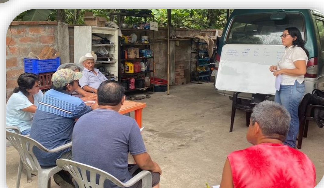
Talleres con productores