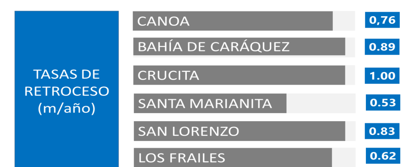
Figura 5. Cálculo de tasas de retrocesos de acantilados.