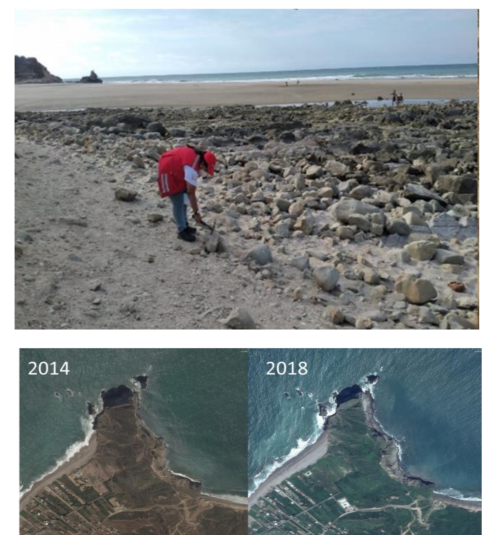
Figura 3. Trabajo de campo y análisis de fotografías aéreas.