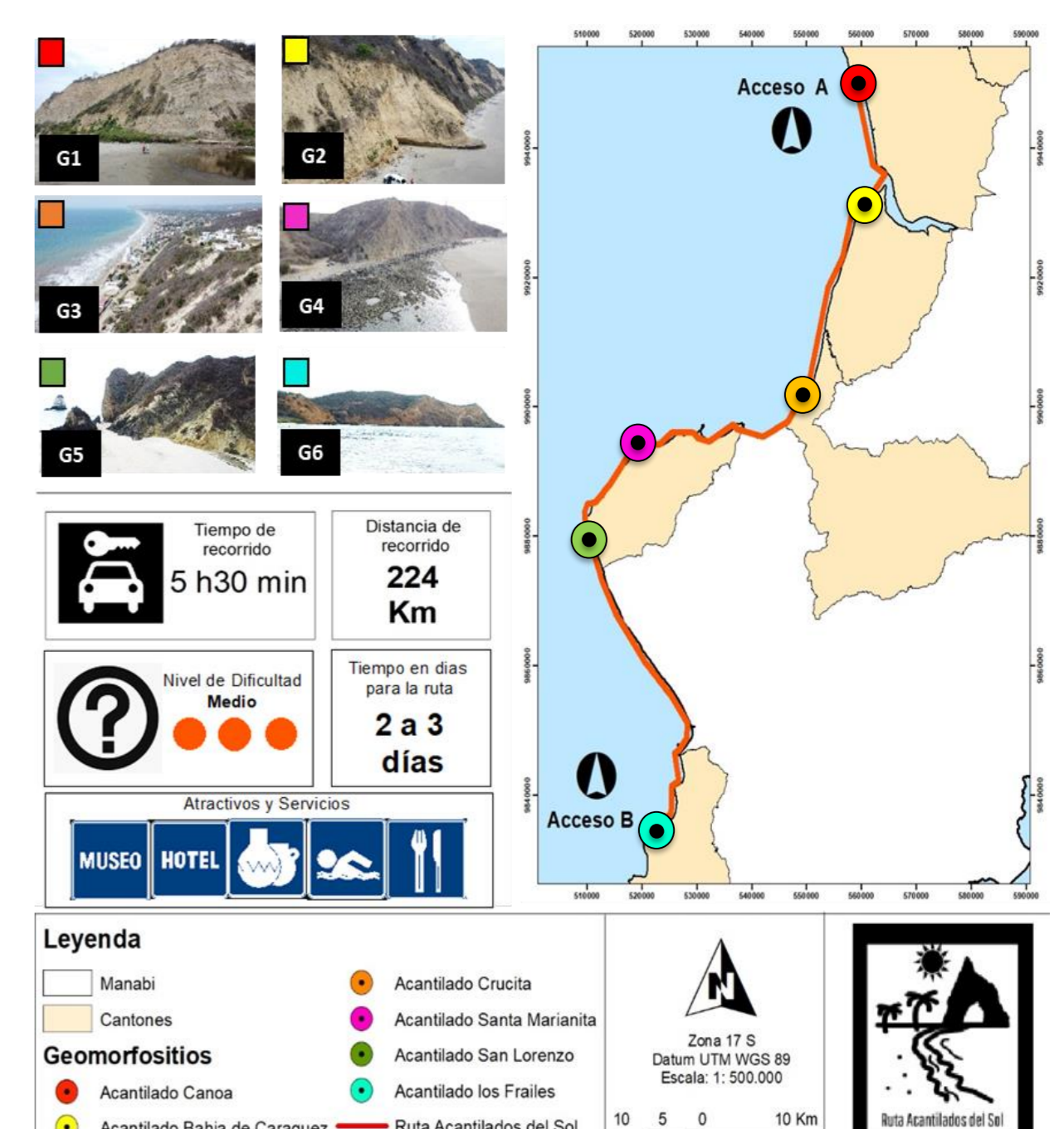
Figura 7. Propuesta de georuta para ser implementada en Manabí.