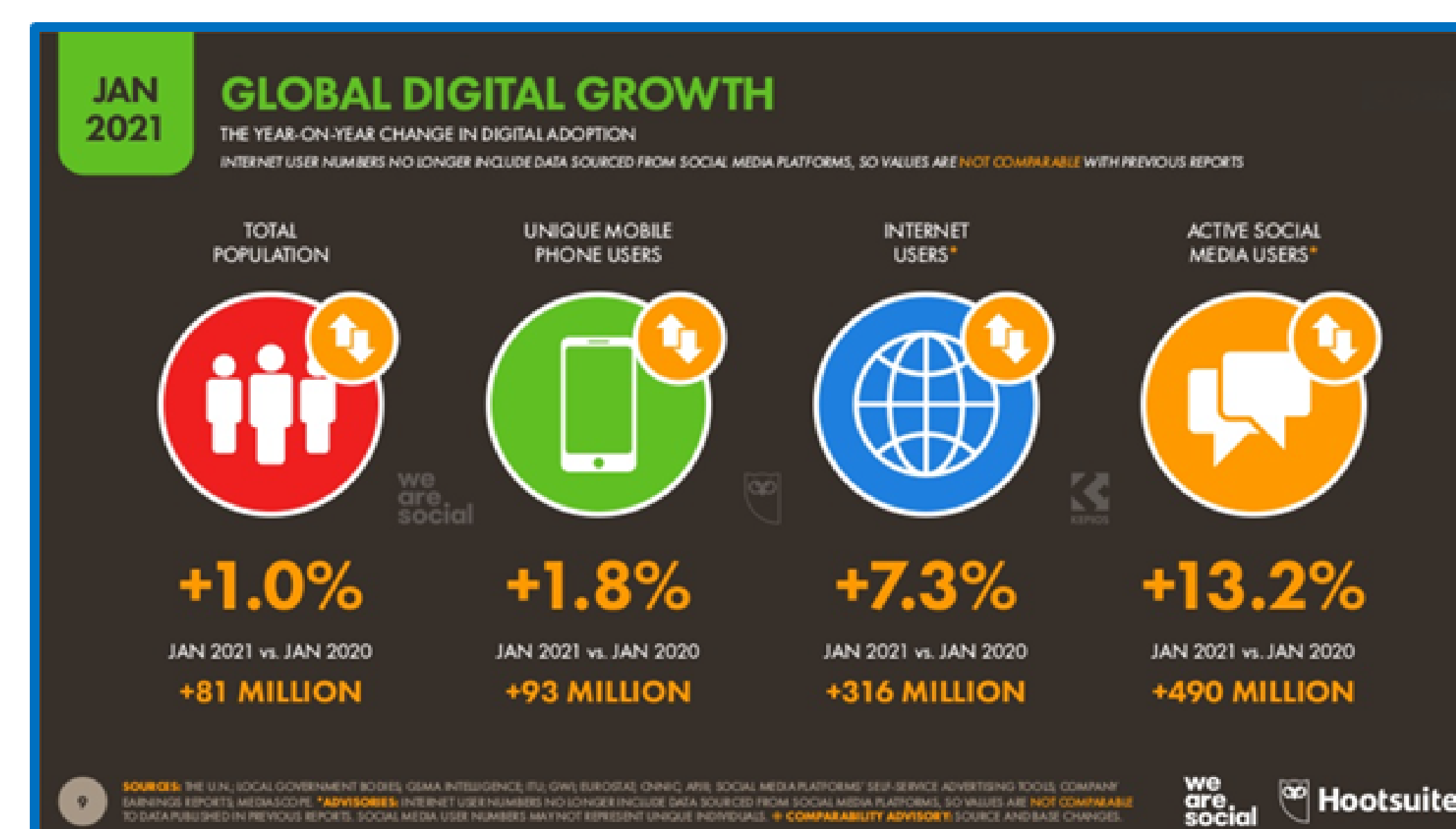
Figura 1. Crecimiento digital mundial del año 2020-2021 [1]

Con el paso del tiempo los usuarios que utilizan el espectro han ido creciendo exponencialmente, por ejemplo, el tráfico de la telefonía móvil se incrementó 4 veces desde el 2010. Por otra parte, la red en la actualidad asciende aproximadamente un 7,3% con respecto al 2020 y esto logra unos 4600 millones de usuarios conectados a internet en el 2021 [Figura 1], que corresponde al 59,5% de la población, este crecimiento se debe por la pandemia de Covid-19, ya que la educación virtual y el trabajo online se hicieron un diario vivir para muchas personas. Debido a este crecimiento de usuarios, la red cada vez se congestiona más, desperdiándose así la enorme capacidad que ofrece el espectro y generando innecesariamente condiciones de escasez, haciendo que las redes telefónicas y otras empresas que trabajan con comunicaciones inalámbricas no puedan brindar un servicio adecuado para sus usuarios