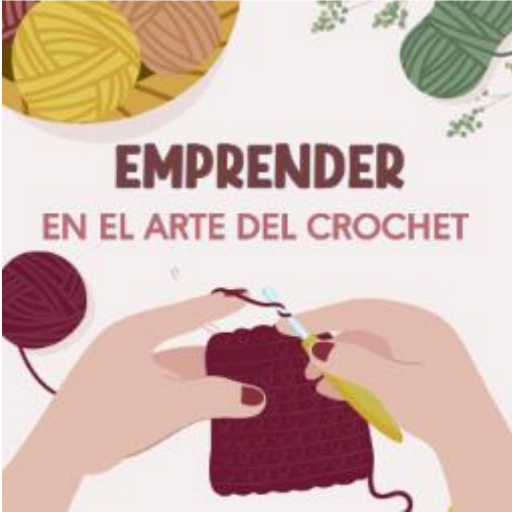
Cápsula 5: Cómo emprender en el arte del crochet