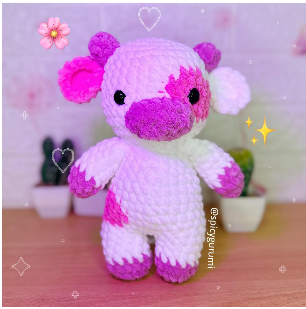
Cápsula 4: Creando mi primer amigurumi