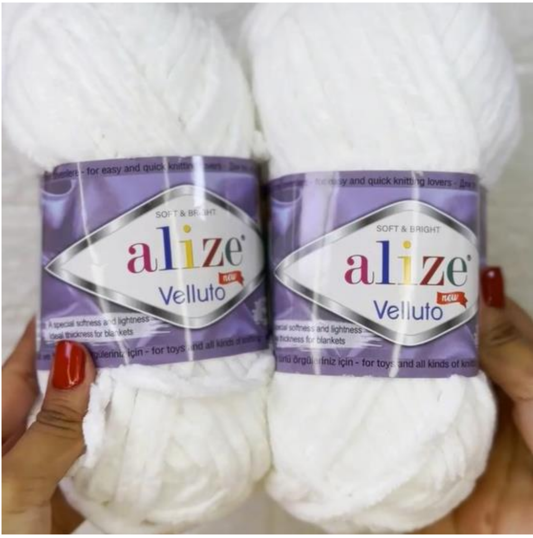
Cápsula 2: Tipos de lana y cómo usarlas