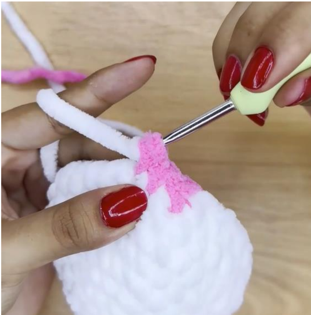
Cápsula 3: Puntos básicos para tejer