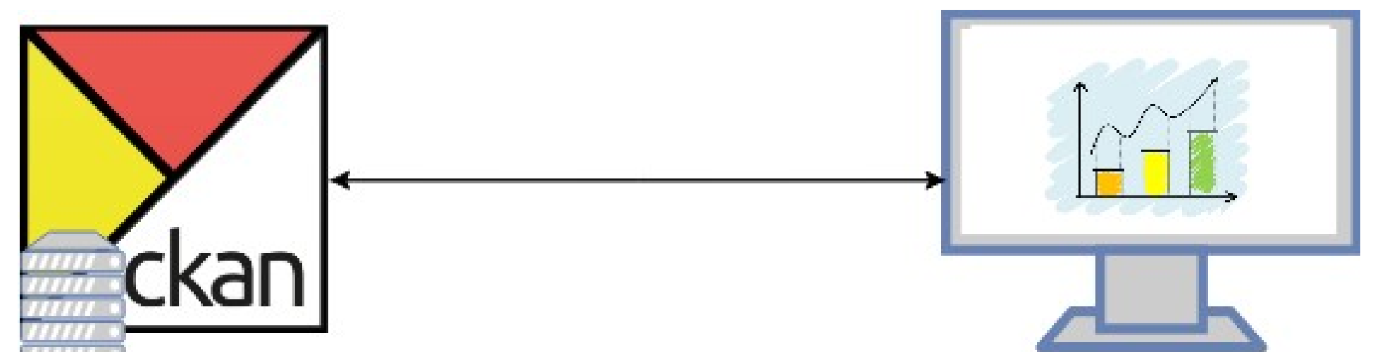
Esquema general del módulo

Como Backend se utilizará un sistema de administración de datos llamado CKAN. Las características de CKAN, nos permitirán manejar grandes cantidades de datos, además de realizar peticiones con tiempos de respuestas muy cortos. Ckan puede crear tablas por cada documento y recurso que se almacena en su base de datos al cual se puede acceder a través de su API.