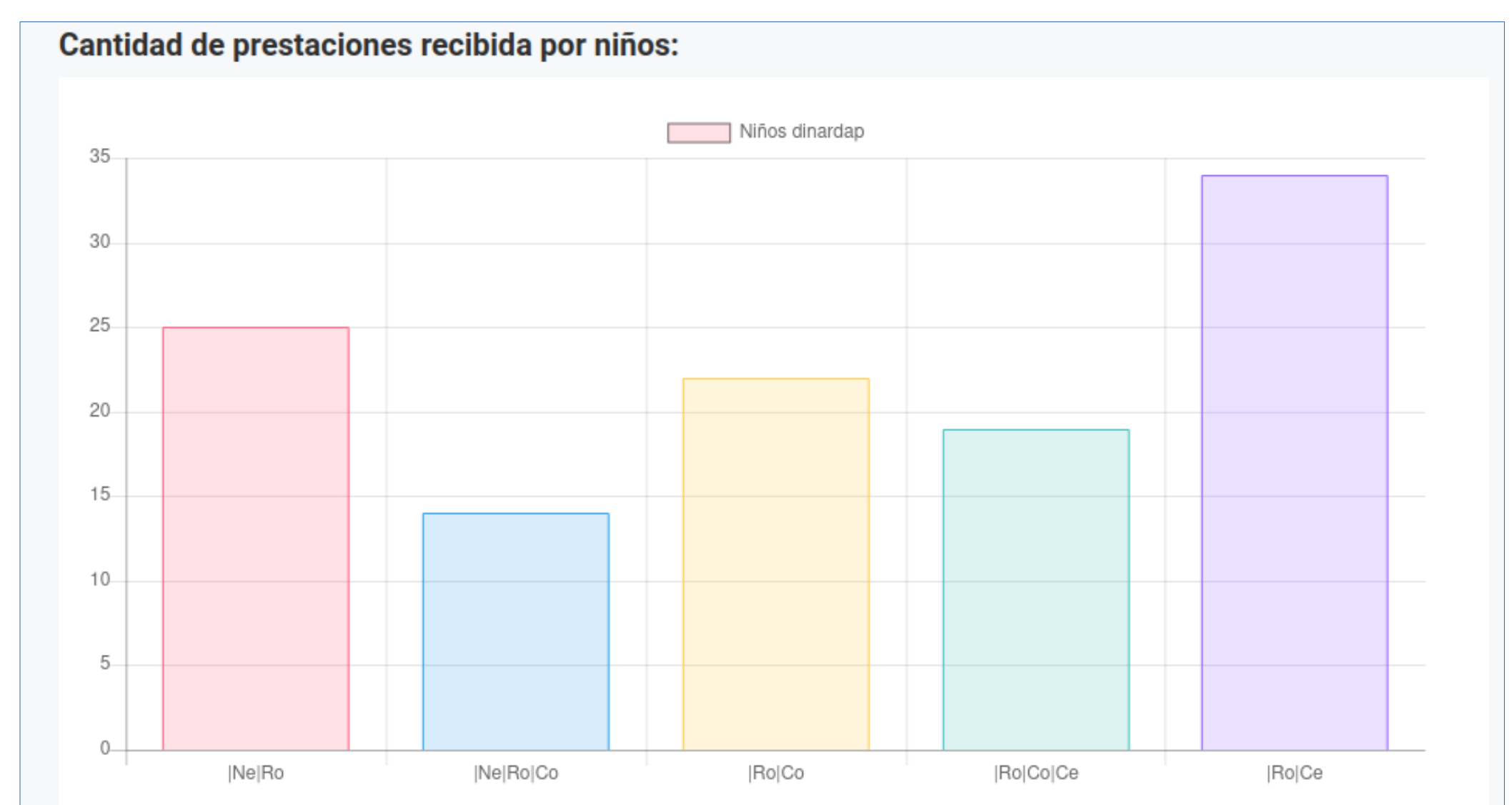
Gráfico de barras modificable