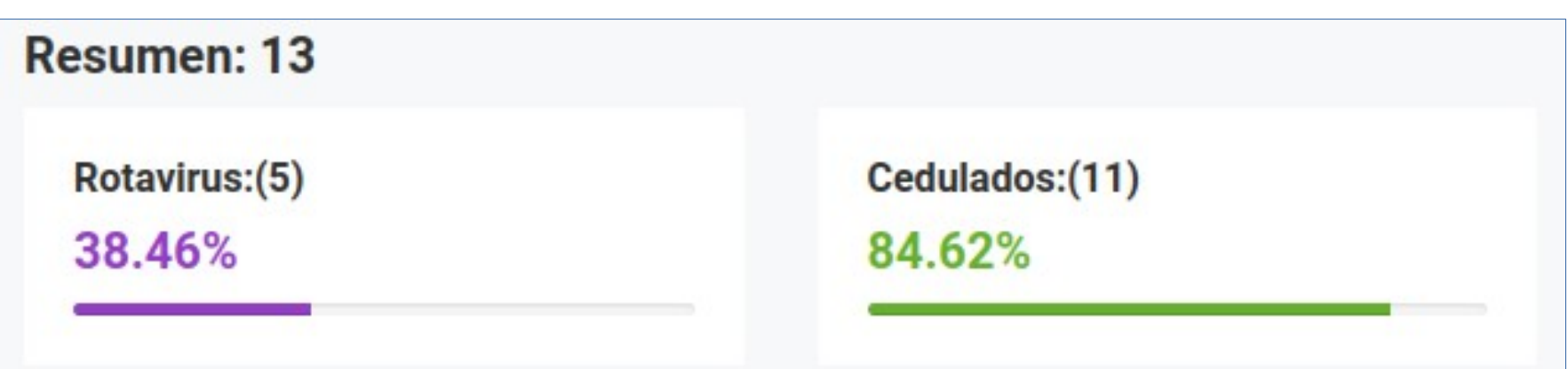
Cajas de porcentajes.