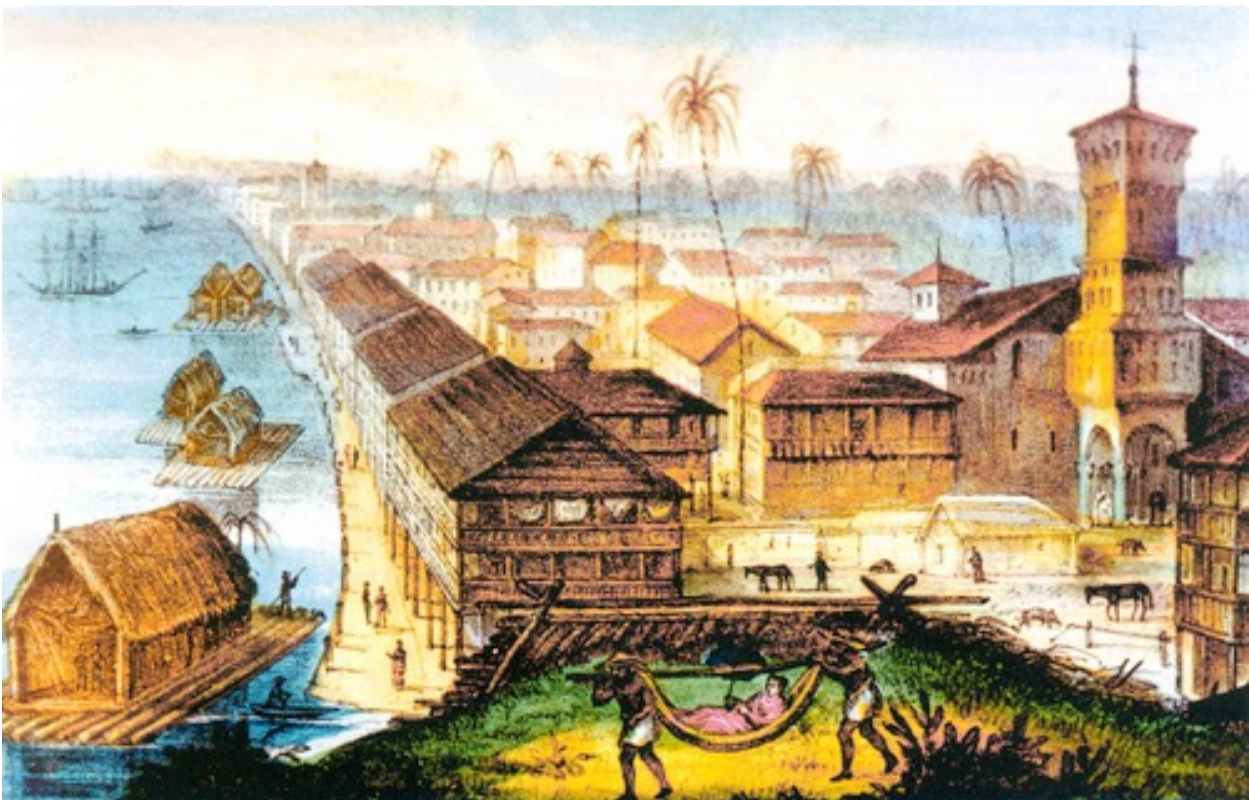
Puerto de Guayaquil pintado por Gaetano Osculatti en 1847.

Se ha prestado poca atención al estudio de la explotación y resistencia de los africanos a y afrodescendiente en Guayaquil durante la época colonial; y, el estudio a través de la arqueología para revitalizar la comprensión y visibilización de dichos fenómenos.