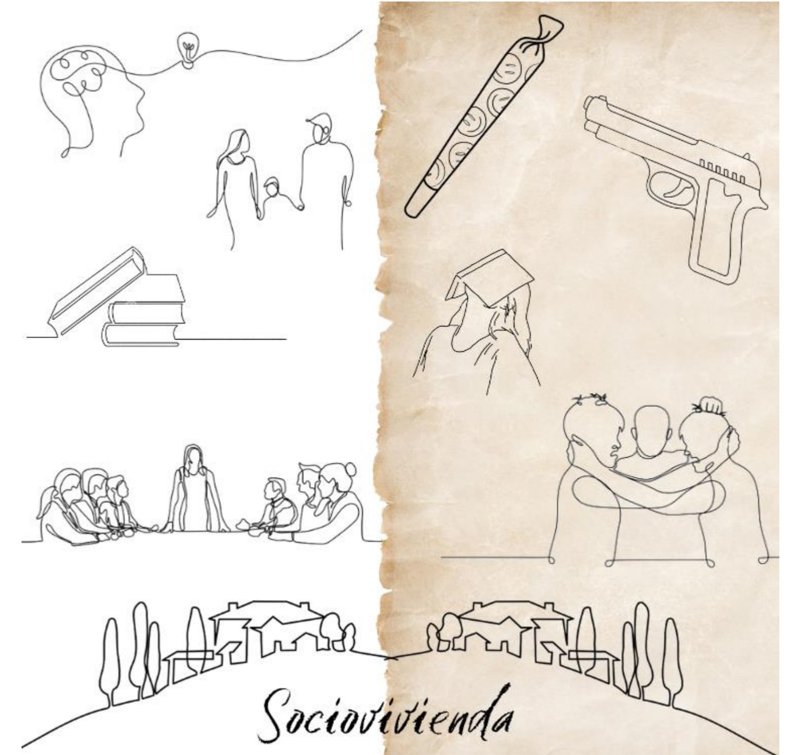
Figura 1: Sociovivienda elaborado por autores

Diseñar estrategias de acompañamiento efectivas que promuevan el desarrollo de destrezas y la aplicación de valores en familias del sector de Sociovivienda en Guayaquil, previniendo y contrarrestando las tendencias delictivas.