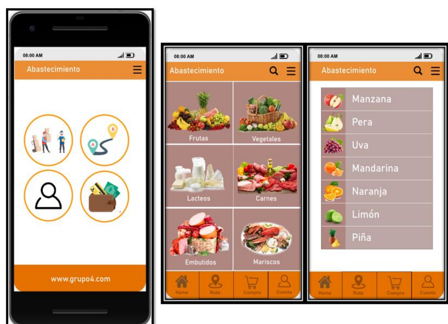
Figura 4 - Pantallas Aplicación de Abastecimiento CosechApp.