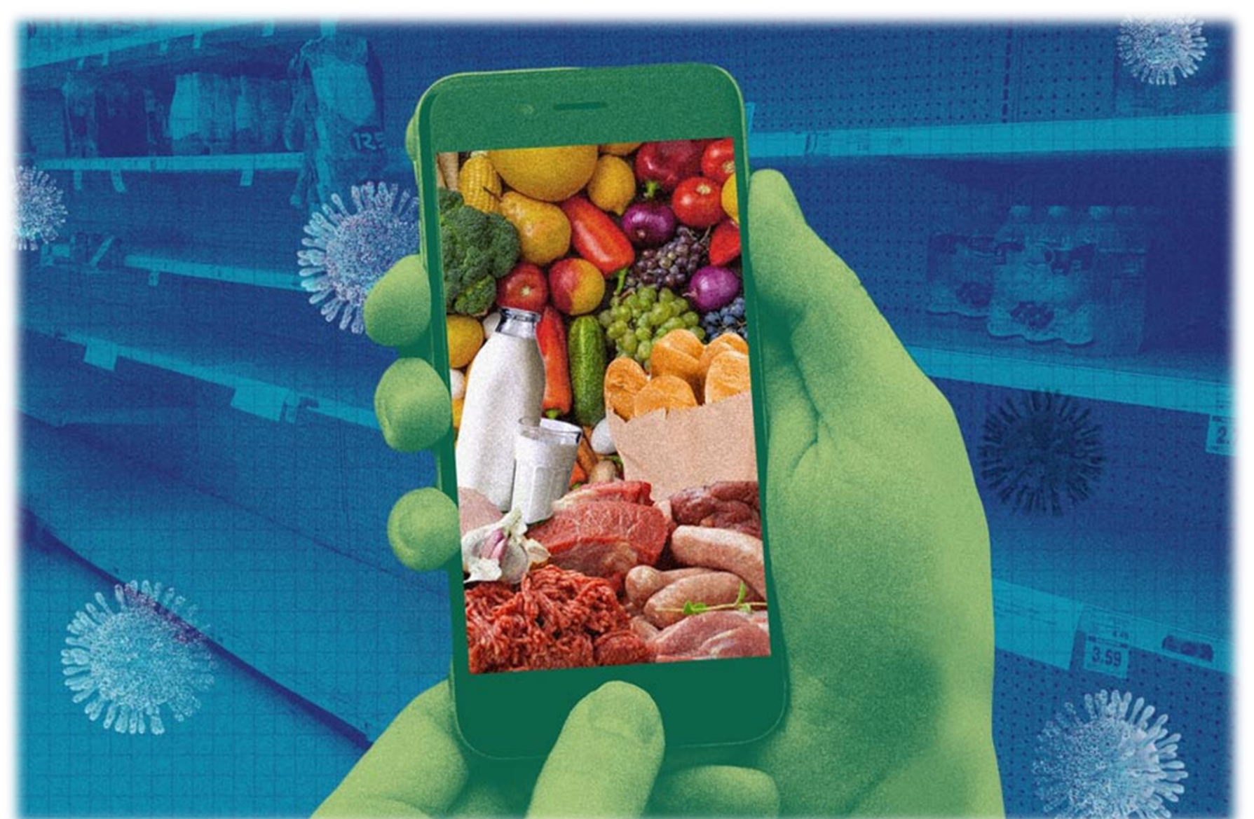
Figura 5 - Diseño de resultados. Aplicación CosechApp.

La aplicación se encuentra estructurada de tal forma que el cliente (usuario final) pueda realizar el pedido de productos en pasos simples para agilizar el proceso de compra. El usuario realiza una solicitud de acuerdo al tipo/categoría de productos, ubica el proveedor con el detalle de información de sus productos (peso, cantidad, precio, horario de entrega, etc.), seleccionando el ítem con sus características, se muestra el detalle del pedido y opción para realizar el pago, una vez realizado este paso se imprime el detalle de la compra, el pago y los datos de entrega.