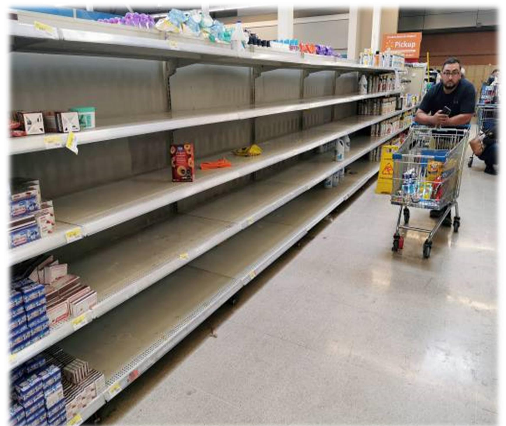
Figura 1 - Problemática causada Covid-19.